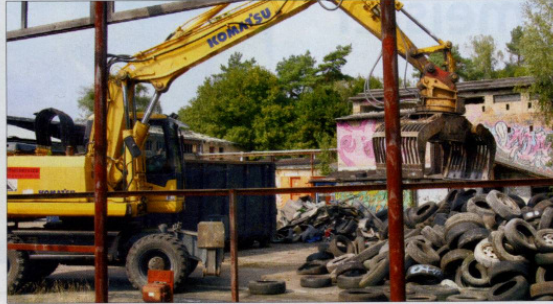
Mit schwerem Gerät vor Ort: Mit dem mobilen Bagger werden die zahllosen Reifenberge in mehrere Container verstaут.